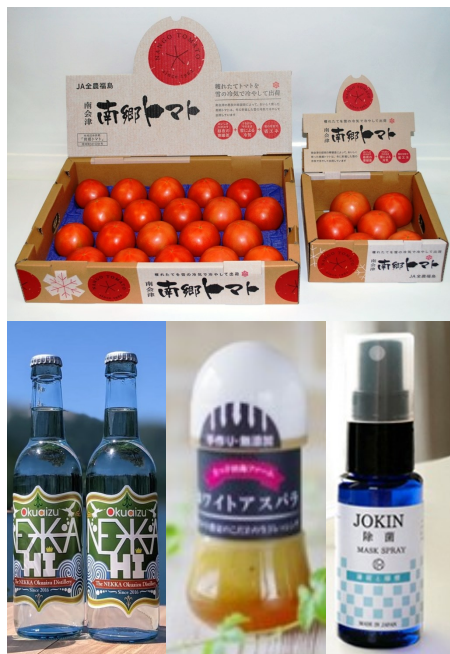
写真はいずれもイメージです。