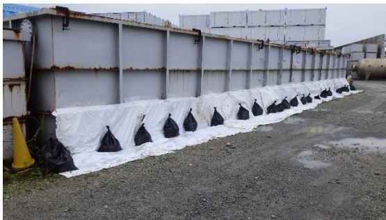
(写真1) ノッチタンクの養生の状況 (南東側から撮影)