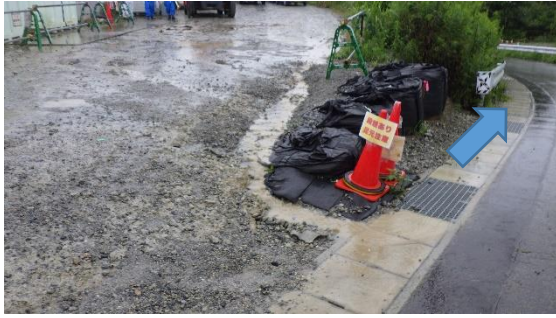
(写真3) 一時保管エリアP南側排水溝の状況 (南側から撮影)