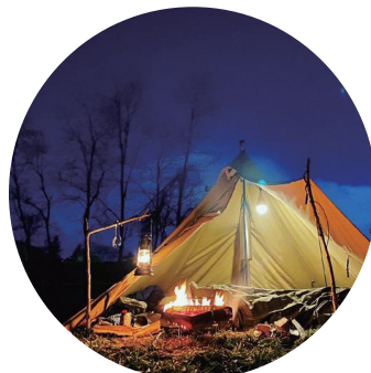
森林レクリエーション