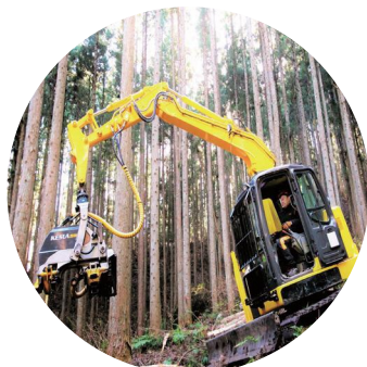
高性能林業機械デモ