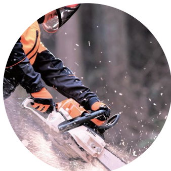
林業アカデミーの紹介