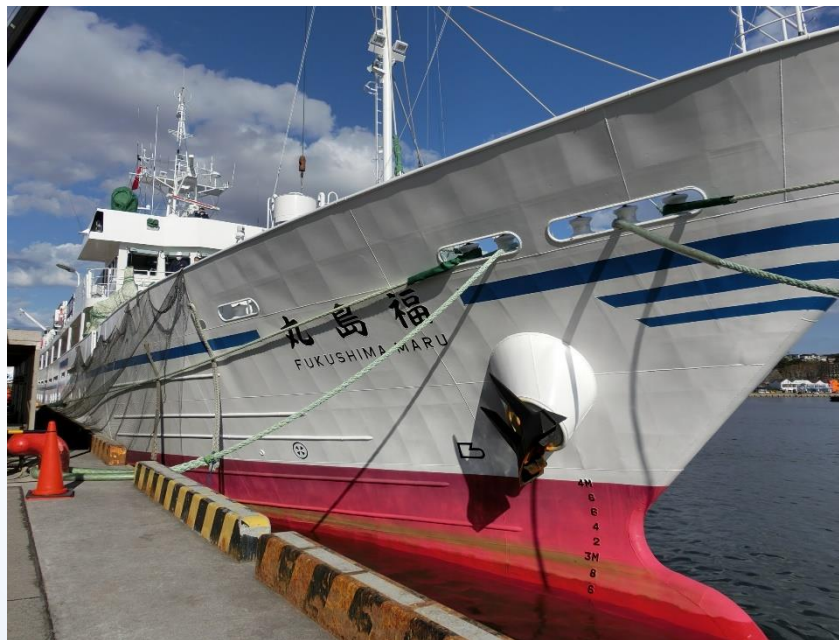
航海実習を終えた練習船「福島丸」