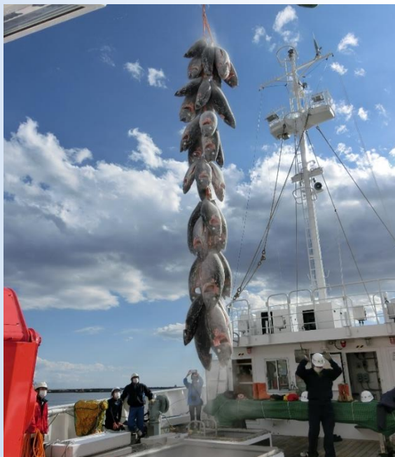
マグロが水揚げされる様子

小名浜海星高校の生徒たちは、9月22日に出港し日付変更線付近の太平洋海域ではえ縄漁の実習を行い、マグロなど約22トンを漁獲しました。