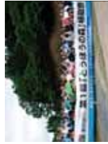
企業等による森林づくりの推進