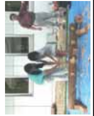
森林文化を体験する機会の創出