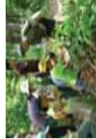
森林環境学習支援