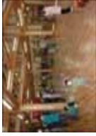
地域における木材利用推進