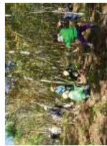
ボランティアによる森林づくり

森林ボランティアの活動支援、企業や団体等による森林づくり、森づくり指導者の育成、森林環境学習の実施