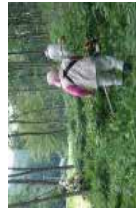
住民に身近な里山整備