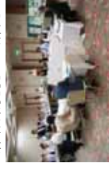
「森林の未来を考える懇談会」の運営