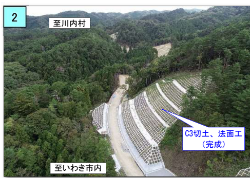
路床面、側溝、法面まで完成しています。