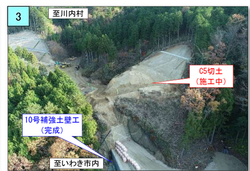
10号補強土壁が完成し、C5切土作業を行っています。