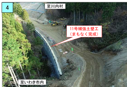
11号補強土壁の最後のコンクリート打設が終了しました。