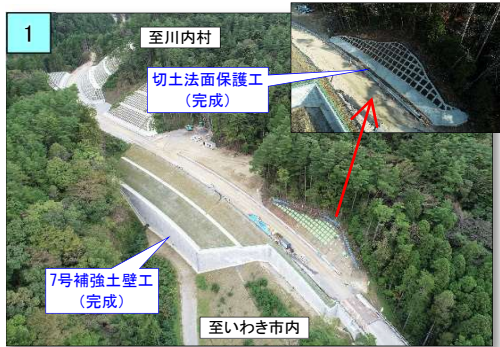
切土の法面保護工が完成しました。

切土を行った法面については、雨水等により表面が浸食を受けてしまうことから植生による保護工を施工しています。法面作業は転落等の危険が伴うため、安全帯をしっかり装着し作業を行っています。