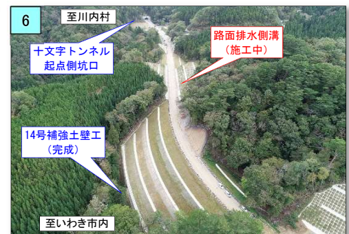
路床面まで完成し、側溝及び法面を施工中です。