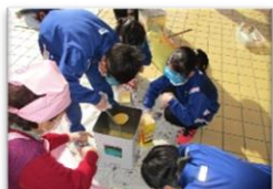
【石けん作りの様子】

本宮市地域学校協働本部では、学校支援コーディネーター（地域学校協働活動推進員）が必要に応じて幼稚園、小学校、中学校を訪問し、それぞれのニーズに合わせたボランティアを紹介しています。