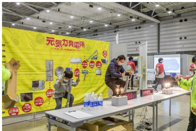
エアロバイクで発電してエネルギーを体感！ 元気力発電所