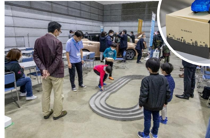
電動自動車モデルカー実験