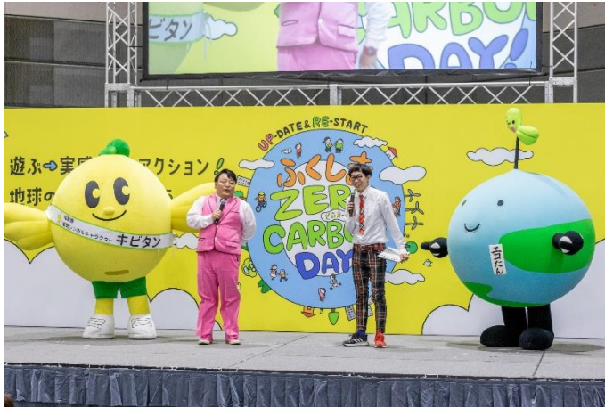
ステージイベント オープニングトーク キビタン/パチッコリンさん/エコたん