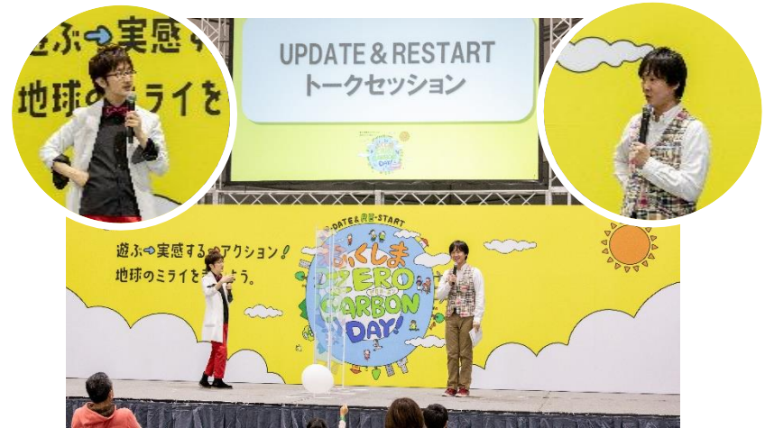
ステージイベント

黒ラブ教授の「SDGs笑って学んでやってみよう！」 国立科学博物館認定科学コミュニケーター 黒ラブ教授