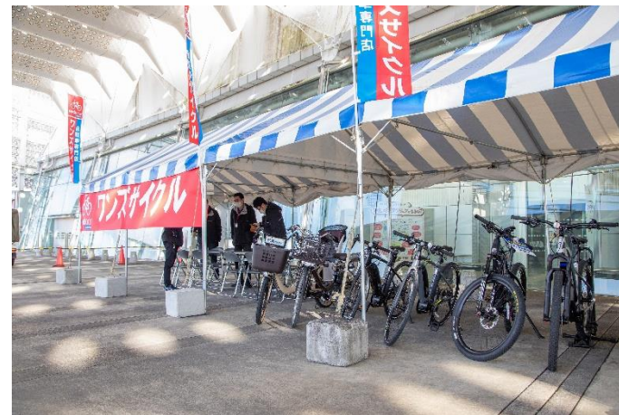
自転車試乗体験コーナー