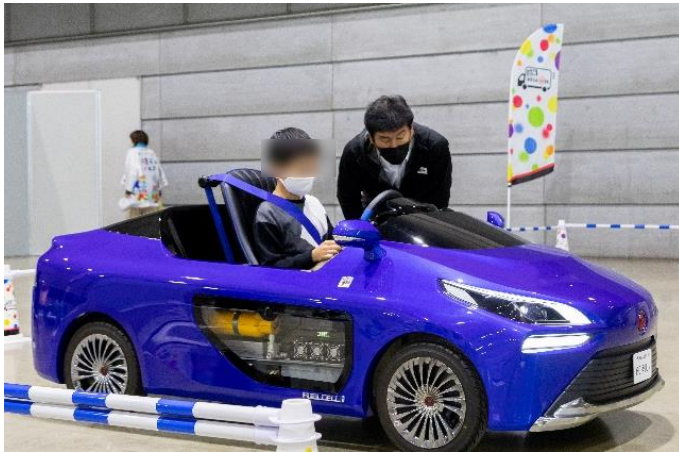
水素カート試乗会