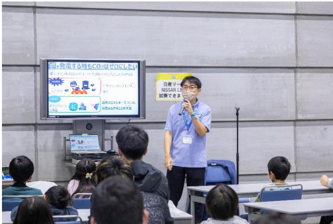
わくわくエコスクール