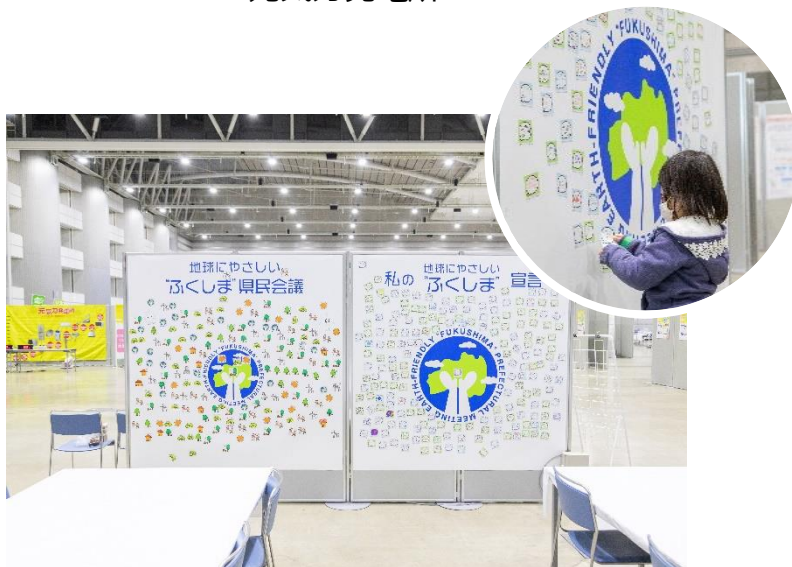
地球にやさしい“ふくしま”県民会議アートボード/ 私の地球にやさしい“ふくしま”宣言