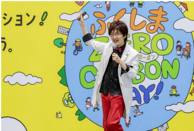
ステージイベント

黒ラブ教授の「SDGs笑って学んでやってみよう！」 国立科学博物館認定科学コミュニケーター 黒ラブ教授