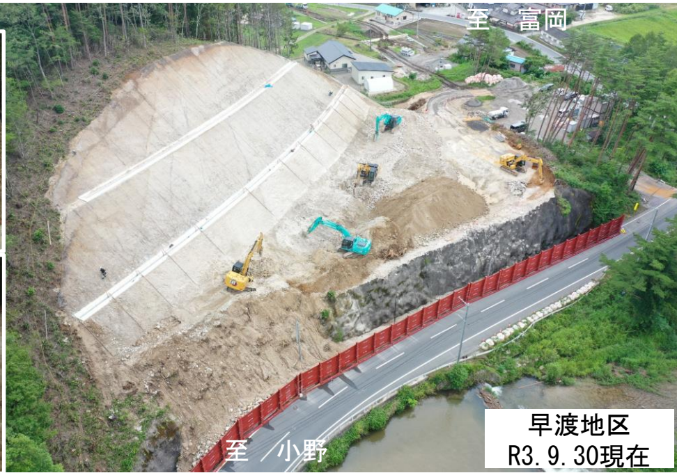
早渡地区 R3. 9. 30現在

県道36号（小野富岡線）では、新しい道路を造る工事を進めています。工事が完了するまでの間、周辺は工事車両が多数通行しますので、皆様のご理解とご協力をお願いします。