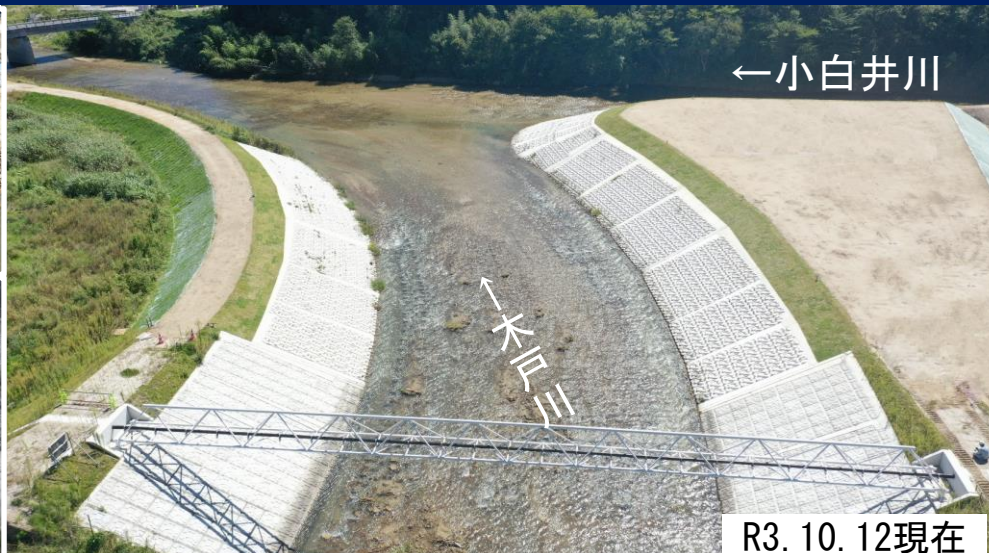
R3. 10. 12現在

木戸川では、河川の幅を広げる河川改修工事を進めています。工事が完了するまでの間、周辺は工事車両が多数通行しますので、皆様のご理解とご協力をお願いします。