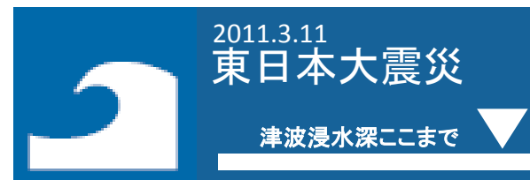
※写真は整備イメージです。

沿岸部において迅速かつ的確な避難を行うための注意喚起手段として、浸水履歴標識を設置するための調査を行います。