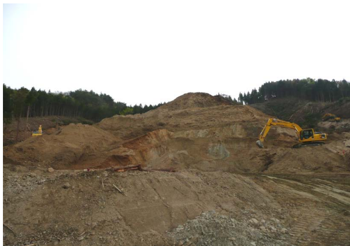
※写真は整備イメージです。

復興事業の課題となっている不足土問題を解消するため、新規土取り場を設置する必要があり、早急に測量・調査・設計を行い、復興に向けたまちづくりを推進します。