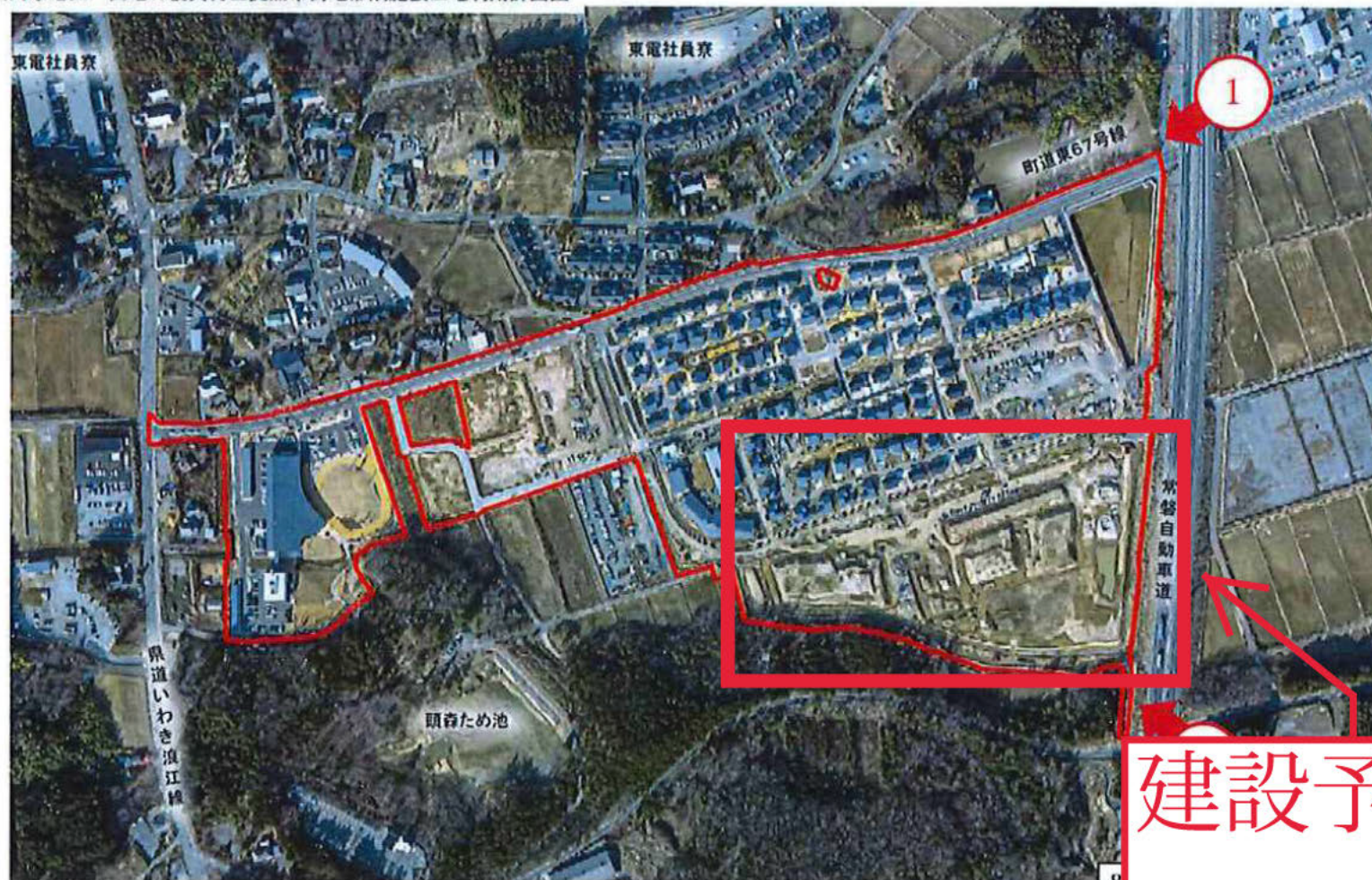
大川原地区一団地の復興再生拠点市街地形成施設土地利用計画図 (令和2年2月3日撮影)