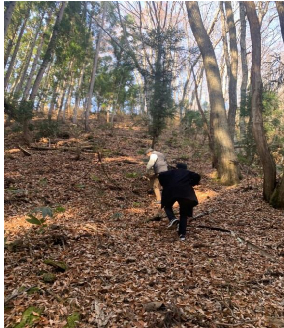
トレッキングコースの視察