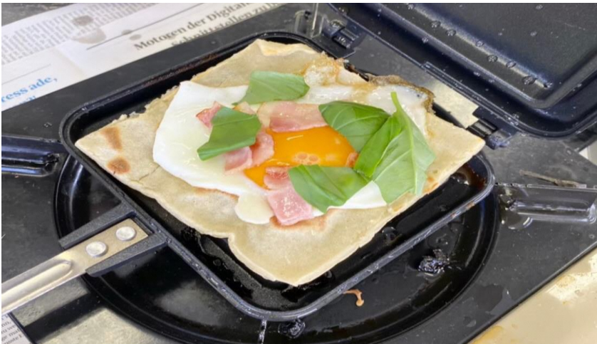
ガレット作成の様子