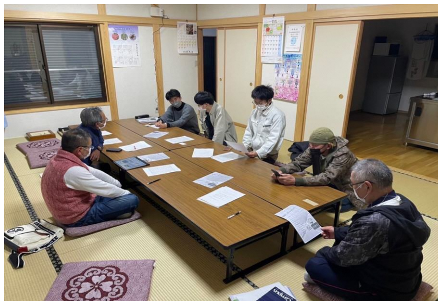
地区の方への聞き取り調査の様子