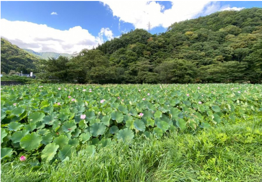
耻風地区にあるハス田の様子