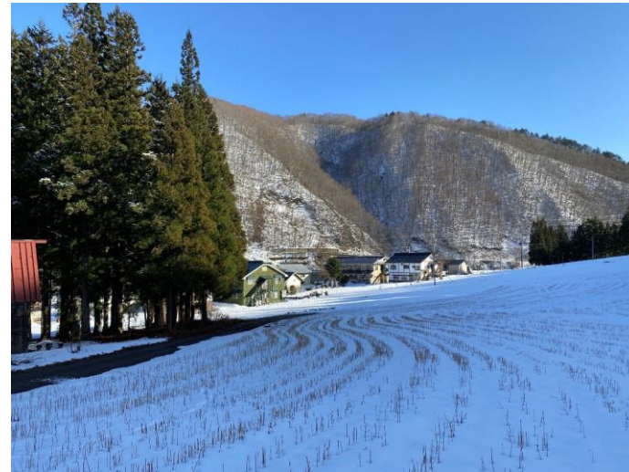
冬の耻風地区の様子