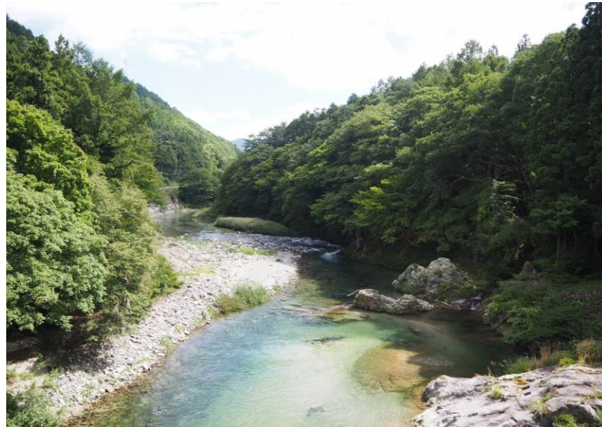
耻風地区を流れる館岩川の様子