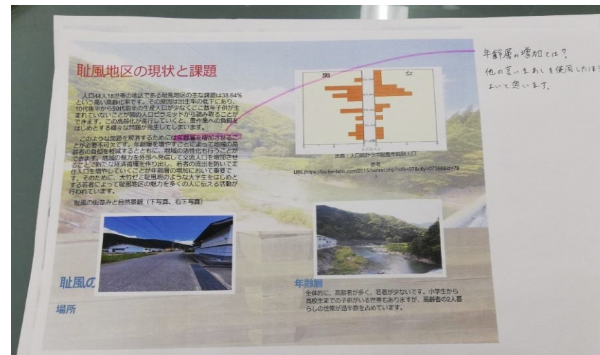
耻風地区の概要 (パンフレット)