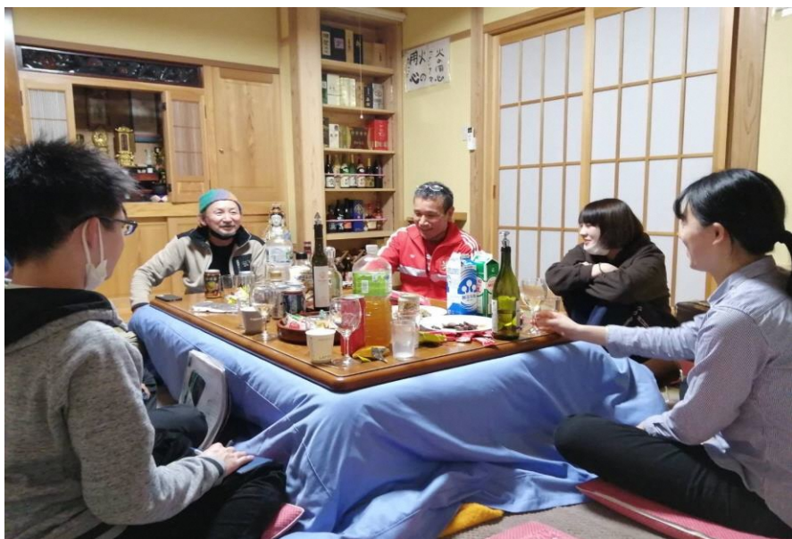
地区の方達との親睦会の様子

自然が豊かであることはたしかに魅力であるが、 それだけでなく地域内の人々のつながりの強さや温かさこそが 本当の魅力であると感じた