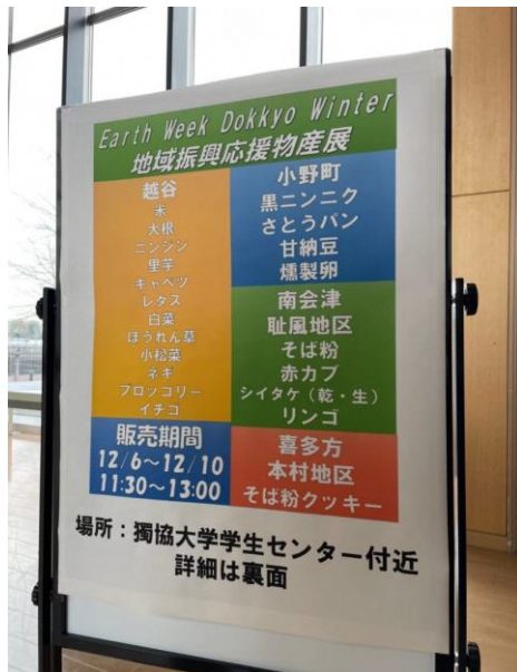
学内に掲示した案内版