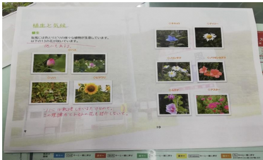
耻風地区で見られる花 (パンフレット)