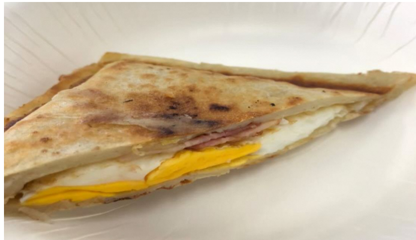
ベーコンエッグ・ガレット