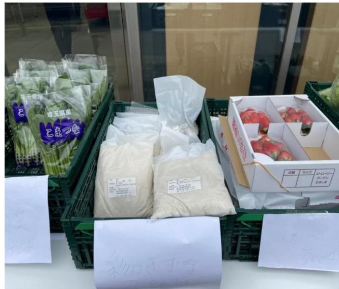
販売した農産物の一例