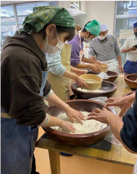
そば打ち体験の様子