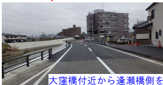
大窪橋付近から逢瀬橋側を望む