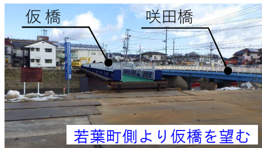
若葉町側より仮橋を望む