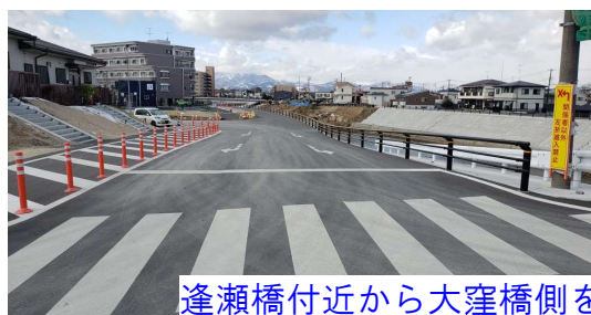
逢瀬橋付近から大窪橋側を望む