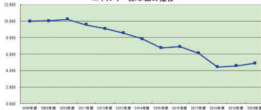
エネルギー原単位の推移

当社では地球温暖化の緩和に向け、省エネ改善活動を計画的に実施し、使用している電力、LPG等のエネルギーに対し、機器の更新や照明のLED化、省エネ機器の導入等の設備投資を含めた効率的な利用を推進しています。効果は生産量当たりの消費量(原単位)で管理しています。