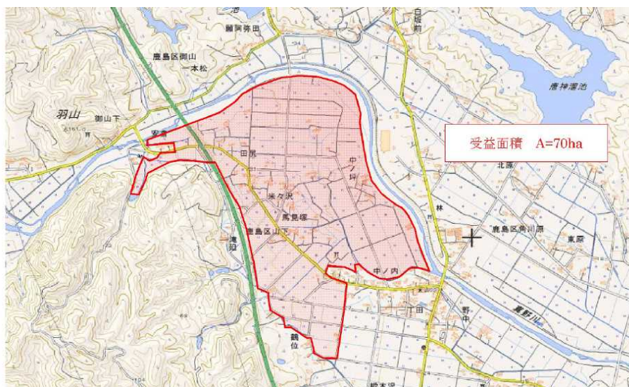
南相馬市 山下地区 事業面積 70ha 調査対象面積 70,000 m 2