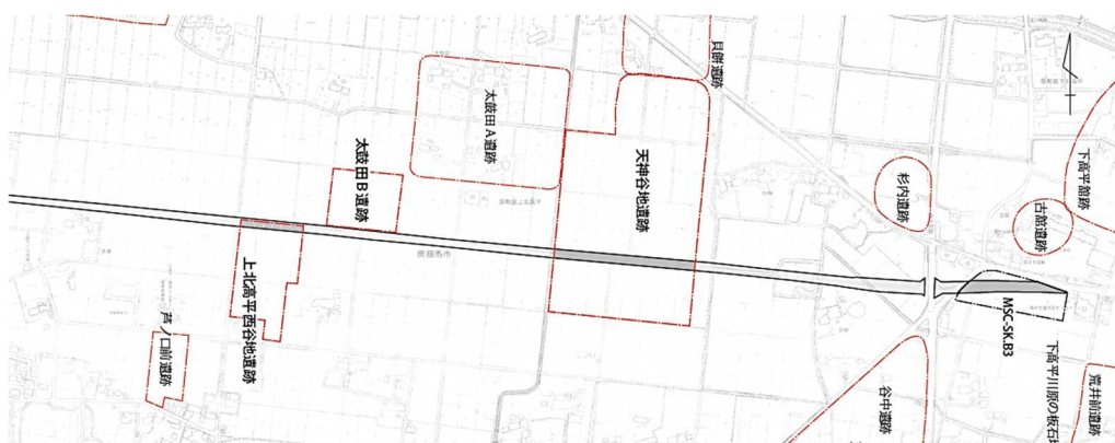
南相馬市 県道原町川俣線((都)下高平北長野線) 調査対象面積 1,000 m 2