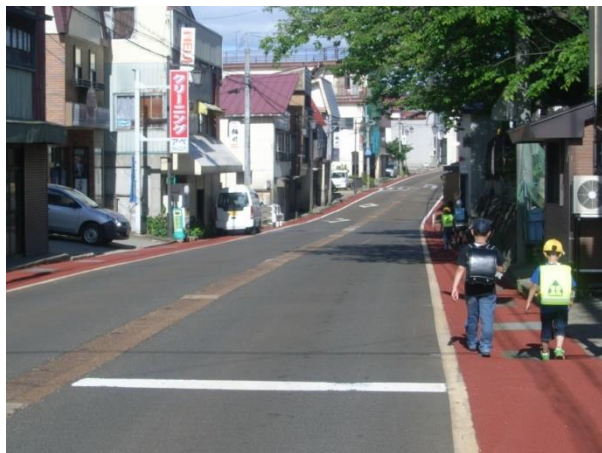
路側帯のカラー舗装化（イメージ）