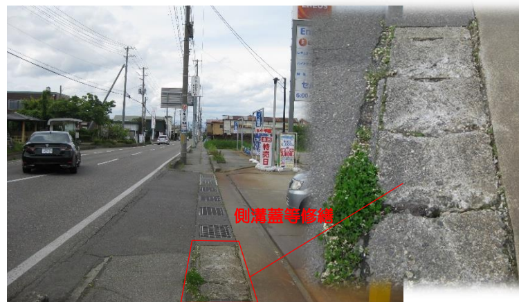
道路の修繕等（イメージ）