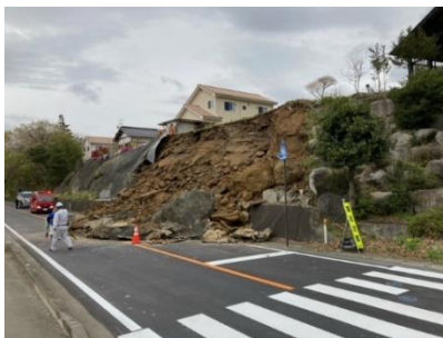
4月13日 いわき石川線(いわき市)