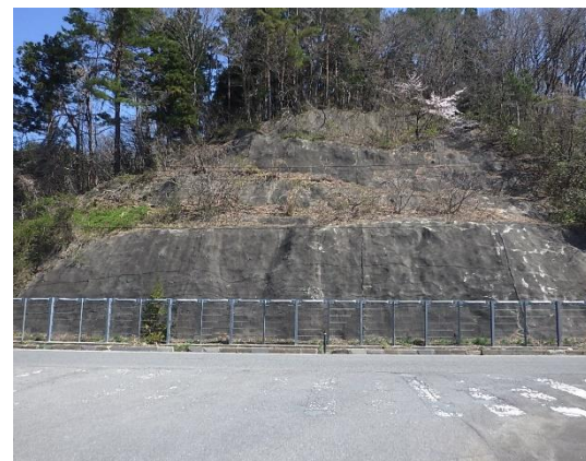
国道294号（郡山市湖南町）