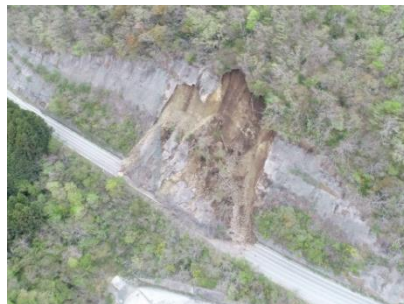
4月14日 国道113号(新地町)