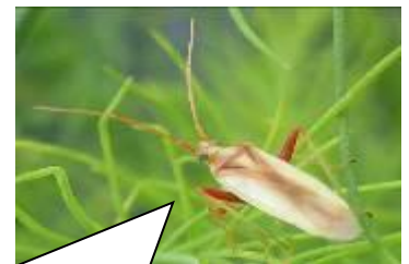
アカスジカスミカメ (成虫)

斑点米カメムシ類は、近年発生が目立っている害虫で、加害されると玄米にシミが生じ等級が低下します。今年についても、7月29日には県病虫害防除所から防除情報が発表されており、発生量は平年並みに多い状況です。主な種類はアカスジカスミカメで、この種類は飛翔能力が高いため、畦畔付近のみならず、ほ場全体の被害に注意が必要です。