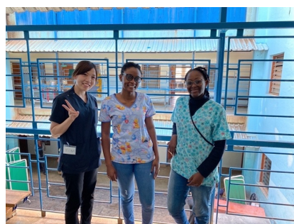
▶整形チームの同僚と