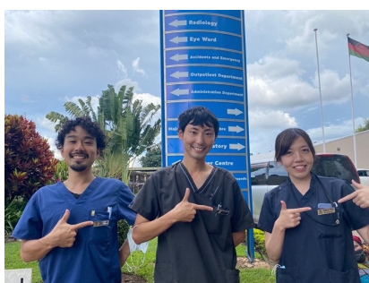
▶最終日に同期・先輩隊員と