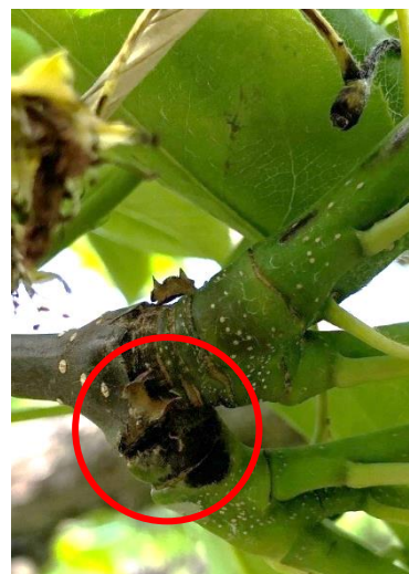
図2 果そう基部病斑 (令和4年5月6日撮影)