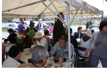
藤の郷 よらっしえ

安 全性が確認された県産農林水産物について、消費者の皆さまへ積極的に情報提供等を行っていただくため、「がんばろう