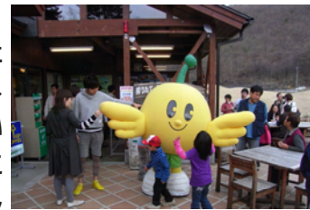
道の駅 しもごう Ematto

なお、去る4月28日から5月1日には、県下一斉「直売所フェア」を開催し、当地域では、「道の駅 たじま」「道の駅 しもごう Ematto」「藤の郷 よらっしえ」の皆さまに御協力いただきました。開催日は異なりましたが、各店舗とも特別メニュー等を用意していただき、盛況のうちに終わることが出来ました。