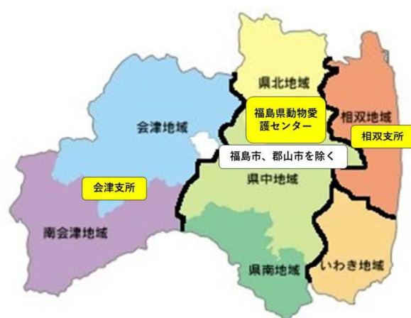
図1 動物愛護管理業務の管轄

管轄地域 相馬市、南相馬市、広野町、檜葉町、富岡町、川内村、大熊町、双葉町、浪江町、葛尾村、新地町、飯舘村