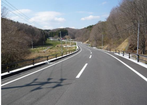
③渡瀬3工区整備完了状況