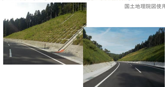
④青生野工区整備完了状況