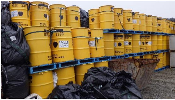
(写真 1 - 5) 仮設集積場所⑱の状況② (エリア南側を南西側から撮影)