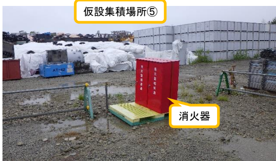
(写真 1-1) 仮設集積場所⑤の状況 (西側から撮影)