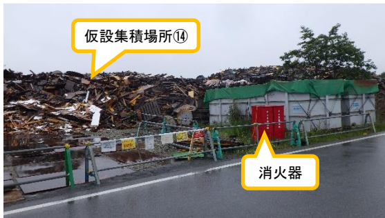
(写真 1-3) 仮設集積場所⑭の状況 (南東側から撮影)