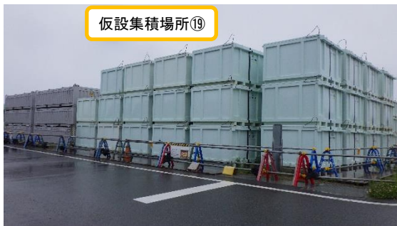
(写真 1-4) 仮設集積場所⑲の状況① (エリア北側を北西側から撮影)