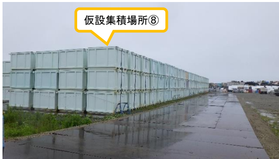
(写真 1-2) 仮設集積場所⑧の状況 (西側から撮影)