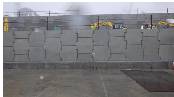
(写真3-2) 斜面補強部の設置状況 (南東側から 撮影) 令和4年5月27日