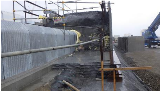
(写真2) 金属製のU字状の枠の設置状況 (南東側から撮影)