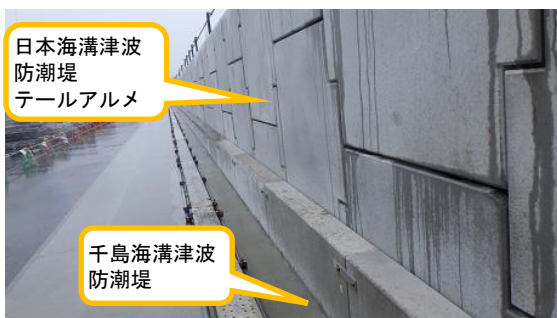
(写真1-1) 日本海溝津波防潮堤本体のコンクリート壁面の設置状況 (南西側から撮影)