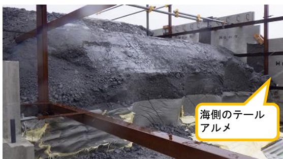
(写真1-2) 日本海溝津波防潮堤本体のアッシュクリート打設状況 (南西側から撮影)