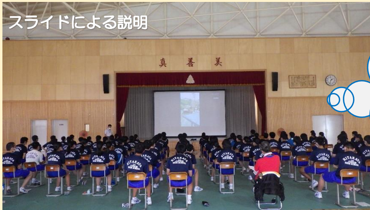
スライドによる説明

防災とは何か、大雨が降るとどのような危険があるのか、自分たちに出来ることは何か（普段の心構えと備え）等について学習しました。