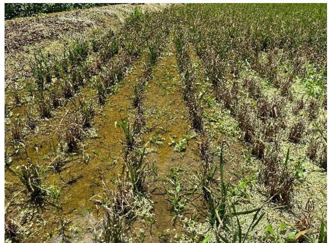
写真 葉いもちが多発した無防除ほ場

注）H22は葉いもち注意報、葉いもちの発生が少なかったH25、H28、R2は穂いもちで注意報を発表