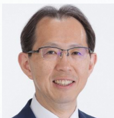
基調講演 『 FUKUSHIMA 』の未来（仮） 福島県知事 内堀 雅雄