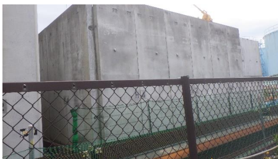
(写真1) KURION用ボックスカルバート