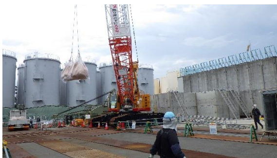
(写真 5 - 1)

剥離したアスファルト舗装が入った1 トンのフレキシブルコンテナバッグ を、クレーンで運搬車へ積み込んでい る状況