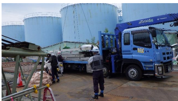
(写真2-1) KURION用ボックスカルバートの コンクリート遮へい板の解体・撤去作 業の状況 (クレーンでの運搬車への積 み込み作業)