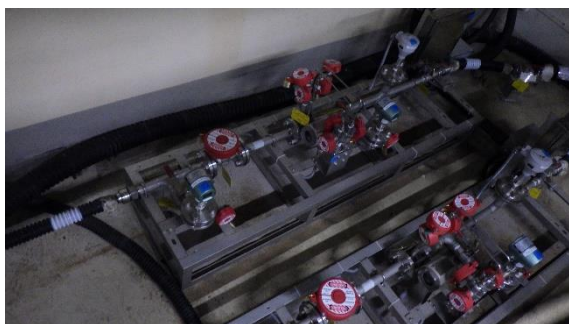
(写真1-2) 流量調整ユニット