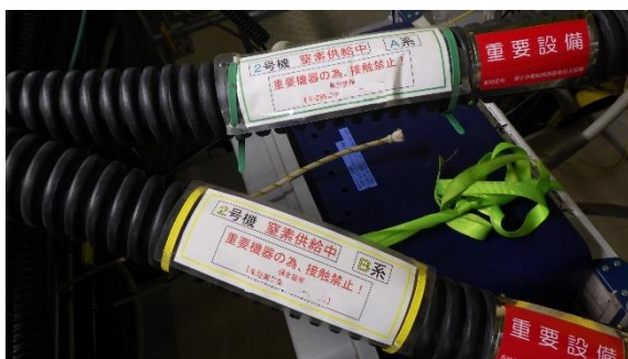
(写真2-2) 窒素封入ライン識別用の標示