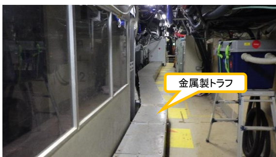
(写真2-1) 窒素封入ラインが収納されている 金属製トラフ（2号機タービン建屋 1階西側通路の状況）