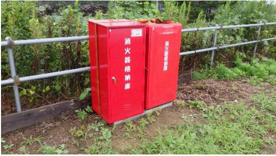
(写真4) 消火器設置状況