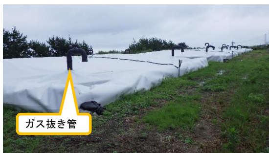
(写真1-1) 一時保管槽の状況