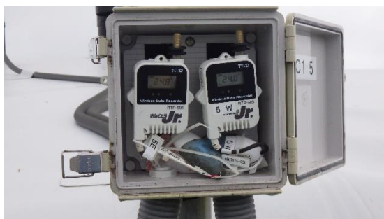
(写真2) 温度計の状況。指示値は24.8℃および24.0℃。