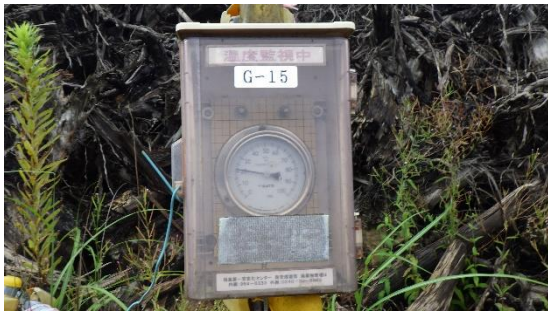
(写真7) 温度計の状況。21.5°Cを指示している。