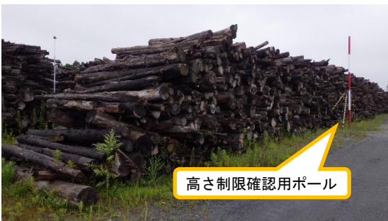
(写真6-1) 伐採木(幹)の保管状況