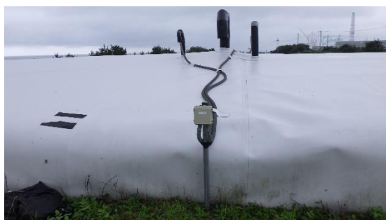
(写真1-2) 温度計の設置状況