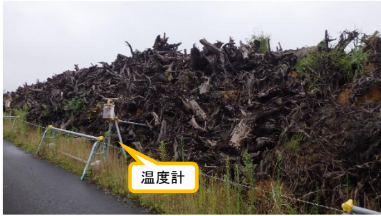
(写真6-2) 伐採木(根)の保管状況