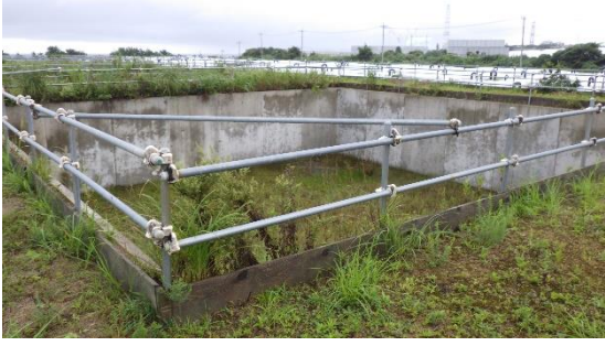
(写真3) 空の一時保管槽の状況。 同じものが全部で6槽ある。