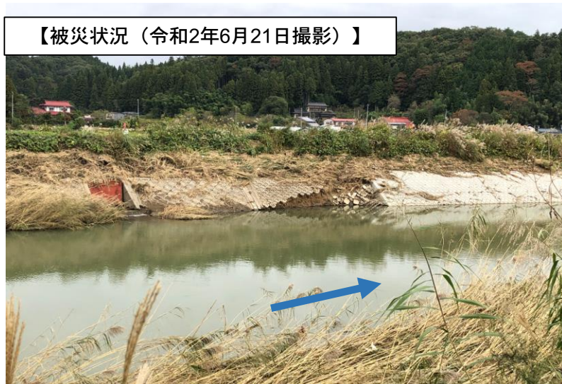
【被災状況（令和2年6月21日撮影）】