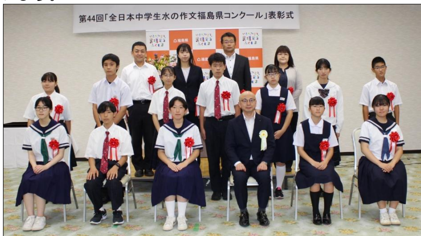
入賞された皆さん、学校賞を受賞された学校の先生方、福島県企画調整部政策監

令和5年2月28日まで第45回の作文を募集していますので、中学生の皆さんからの応募をお待ちしています。