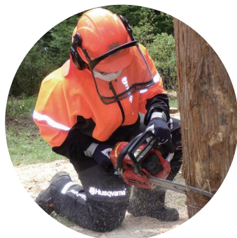
林業アカデミーの紹介