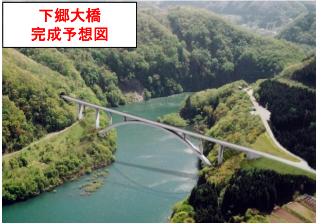
下郷大橋 完成予想図