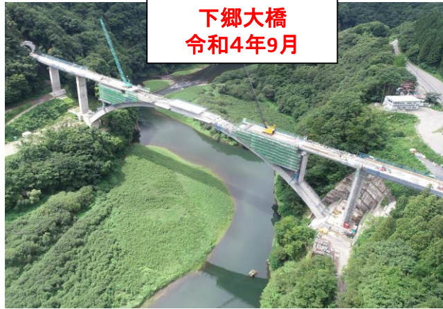
下郷大橋 令和4年9月