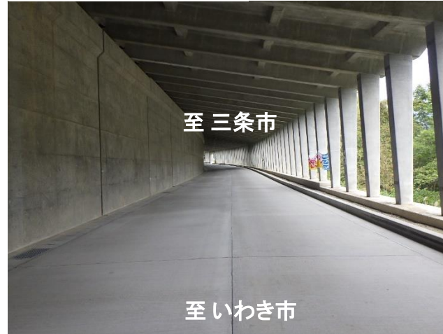
スノーシート工事状況