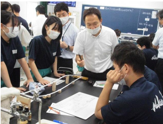
トリプルコースターを使った実験

「単元3 運動とエネルギー（第三章 エネルギーと仕事）」で、「力学的エネルギーの保存について理解し、位置エネルギーと運動エネルギーの移り変わる様子からレール上の物体の運動の速さの変化を科学的に説明することができる」を本時のねらいとして授業が行われました。子どもたちは、大変意欲的授業に臨んでいました。