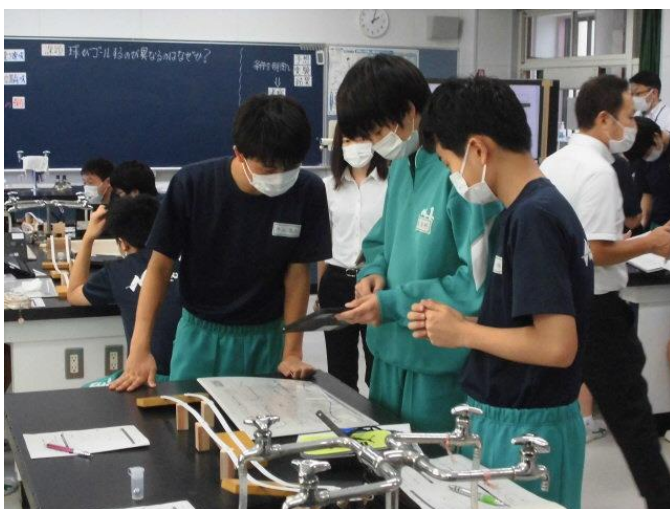
ジグソー班で実験結果の共有