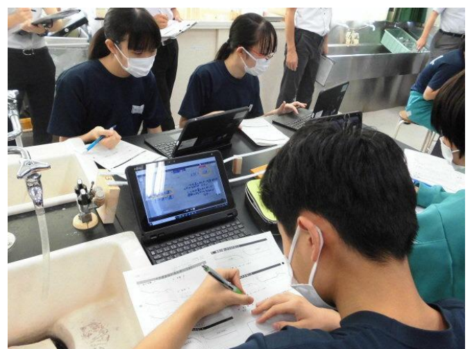
まとめたことを自分のタブレットを使って共有する