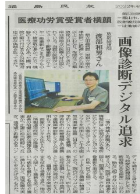
（R4.1.18福島民友より） ～都道府県医療功労賞受賞～