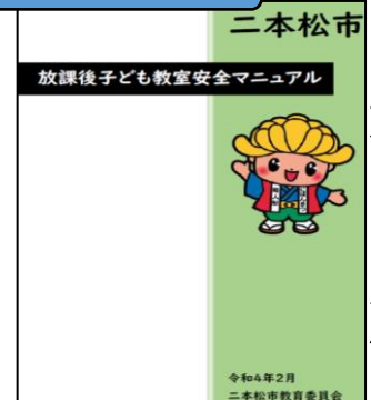
～放課後子ども教室安全マニュアル～

「工程表を見れば次に何をすればよいかすぐわかるね。」 「年間予定表を見ていると、これからの活動が楽しみになってくるよ。」