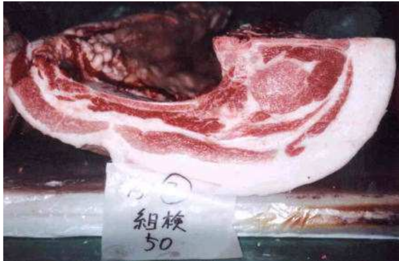
フクシマL2の枝肉の写真