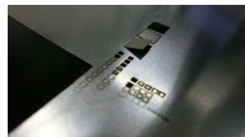
ステンレス箱の切り抜き加工