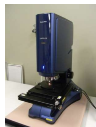
走査型レーザー顕微鏡 (3,230円/時間)