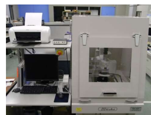
非接触3次元測定装置 (6,720円/時間)