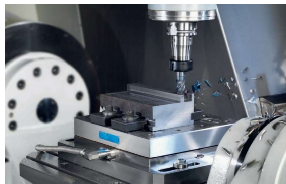
(日本キスラー（株）カタログより)