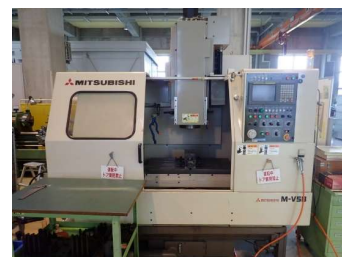
立形マシニングセンタ (450円/時間)