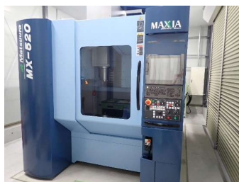
5軸マシニングセンタ (11,180円/時間)