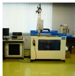
超音波探傷映像化装置 (8,090円/時間)