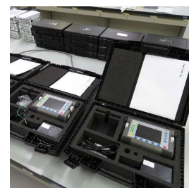
超音波探傷器（Gタイプ） (810円/時間)