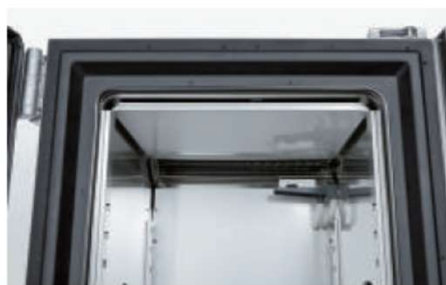
槽内天井水滴落下防止