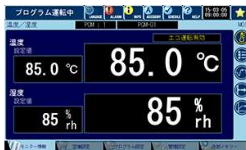
タブ方式ユーザーインターフェース