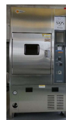
キセノン促進耐候性試験機 (990円/時間)