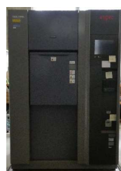
熱衝撃試験機 (1,450円/時間)