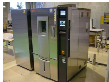
※本装置は（公財）JKAの補助事業（機械工業振興補助事業）により導入されました。