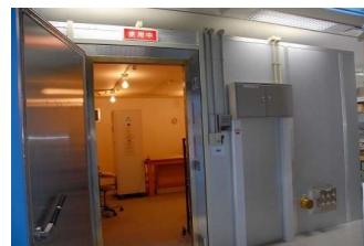
広帯域シールドブース (3,040円/時間)