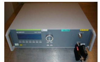
伝導電磁界イミュニティシミュレータ (2,220円/時間)