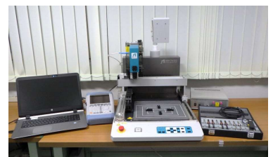
ノイズ源探索装置 (4,050円/時間)