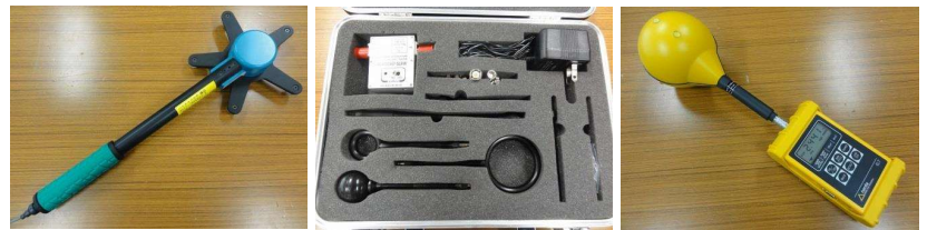
&lt;標準磁界センサー&gt;