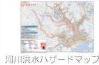
河川洪水ハザードマップ