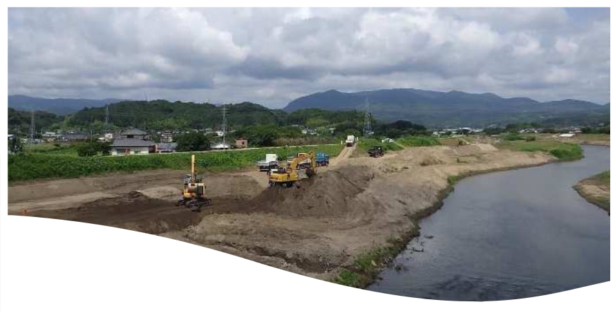
夏井川 磐城橋上流