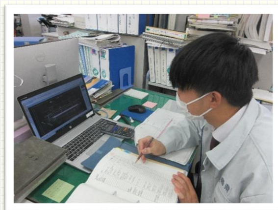
↑工事内容の変更作業を行っています

私は生まれ育った福島県が大好きです。安心して暮らせるまちづくりを行い、県民の方々にもっと福島県を好きになってもらいたい、道路を整備し、県外の方々に福島県に来てもらいたいという思いから県の土木職員を志望しました。