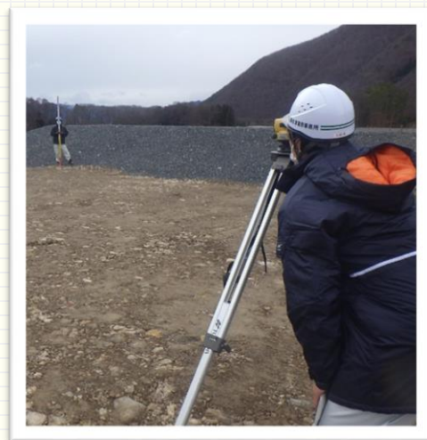
↑工事現場の完了確認

入庁前は、職員一人一人がそれぞれの仕事をこなしていくというイメージでしたが、実際は、一つの仕事をみんなで助け合ってこなしていきます。南会津建設事務所は、まさに「ワンチーム」という言葉がぴったりだと思います。相談しやすく、頼りになる上司や先輩職員ばかりです。