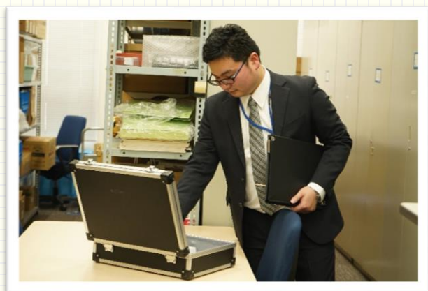
↑物品の附属品及び動作の確認

警察事務職員として、現在担当する業務を適切に行うことで、警察官の迅速かつ的確な活動が実施可能となり、県民に安全・安心を届けることができます。今後も、迅速かつ適正な事務処理を心懸け、各種警察活動に貢献していきたいです。