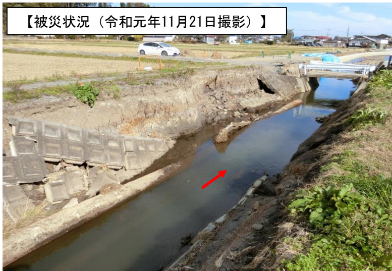
【被災状況（令和元年11月21日撮影）】