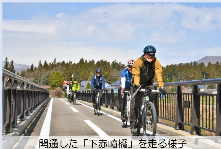
開通した「下赤崎橋」を走る様子

◆大川喜多方サイクリングロード 利活用推進会の委員の方たちと共に 自転車道を軽快に走りました。