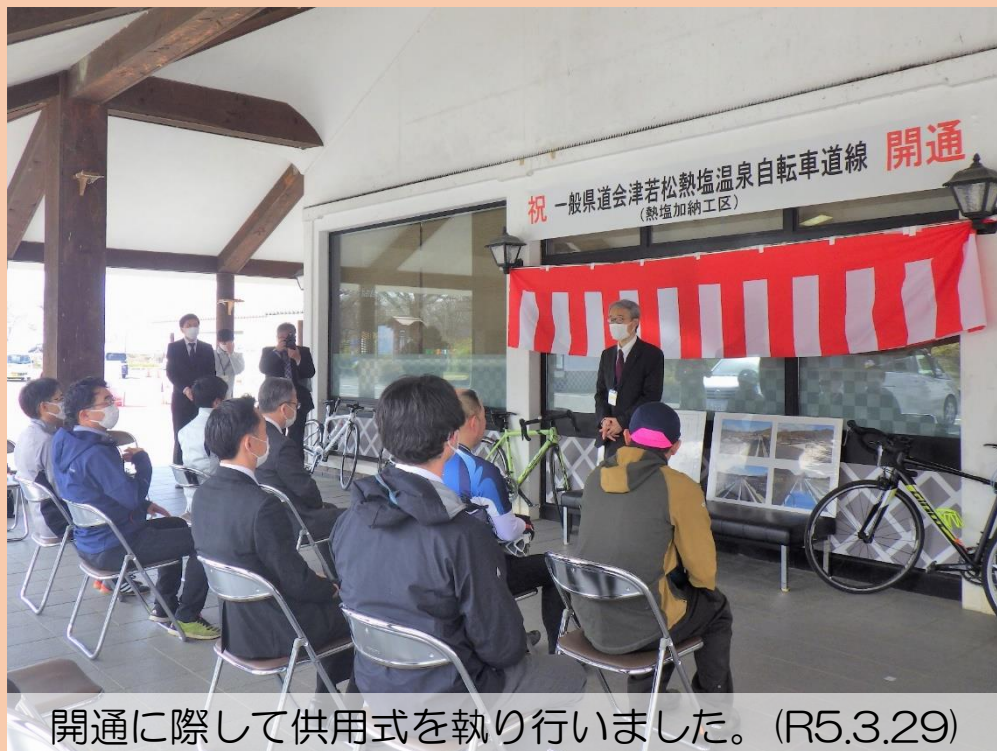
開通に際して供用式を執り行いました。(R5.3.29)